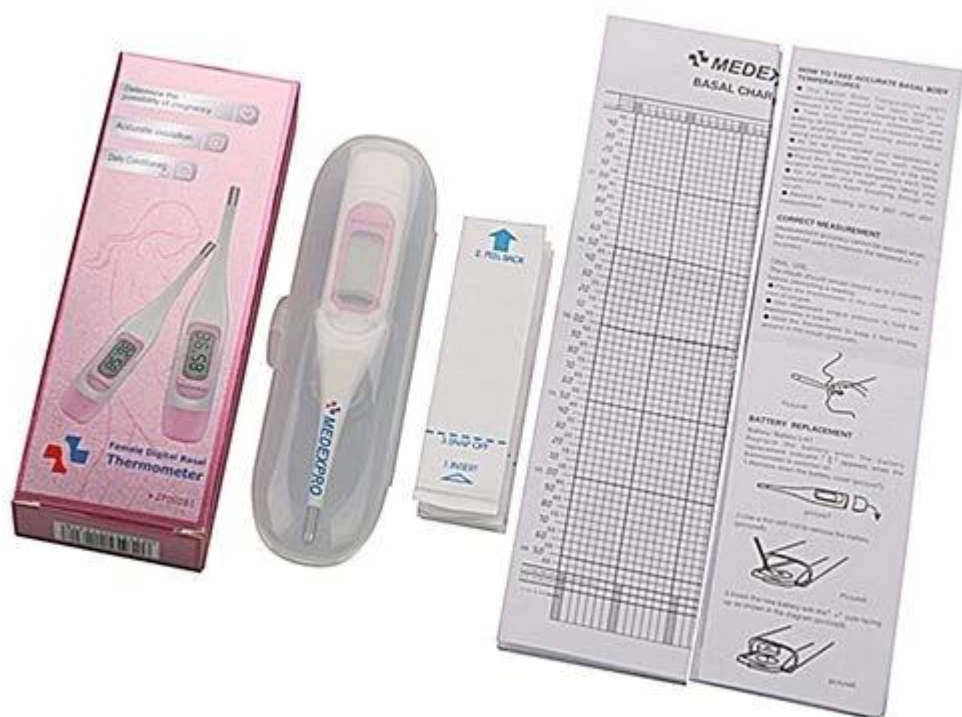
Illustration de produit